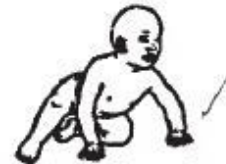
Arrodillado en 4 apoyo hacia sedente o 1/2 sedente.

Flexión de una cadera. Extensión de la otra. Barzo en flexión. Cabeza en 90°. Movimientos recíprocos de extremidades superiores e inferiores con rotación de tronco.