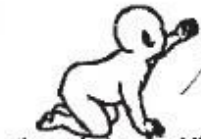
Alcance desde una posición de soporte con el brazo extendido

Hombros abducidos, caderas abducidas y rotadas externamente. Lordosis lumbar. Cambio de peso de un lado a otro con flexión lateral de tronco. Movimientos recíprocos de extremidades superiores e inferiores.